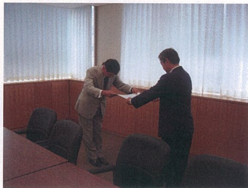
滋賀国道事務所での表彰風景