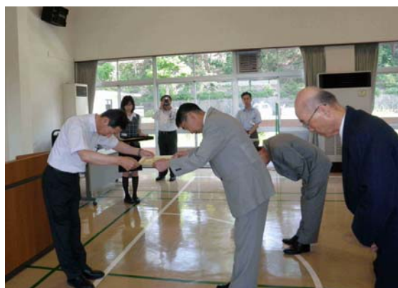
近畿技術事務所での表彰風景 (平成22年7月22日撮影)